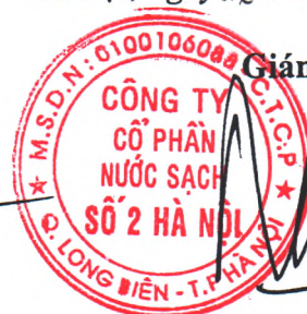
Tạ Kỳ Hưng